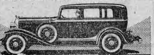
BOLANOS & ULLOA, S. A. AGENTES